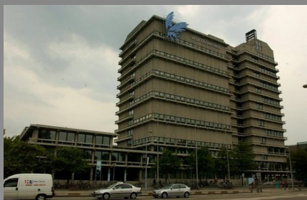
Het hoofdgebouw van de Vrije Universiteit Amsterdam